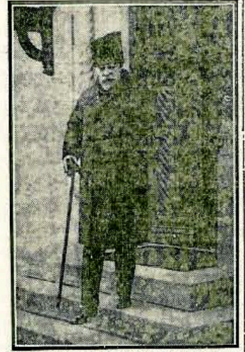
Ultima fotografie a lui Ion I. C. Brătianu. Fostul prim-ministru este delat locuința sa

Opera marelui dispărut este o lucrare de mare valoare. Ea reprezintă o contribuție importantă la cunoașterea istoriei și culturii noastre. Este o lucrare de mare valoare care merită să fie cunoscută de toți românii.