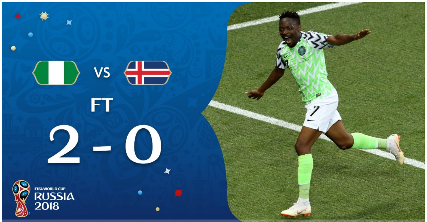
Twitter Fifa World Cup