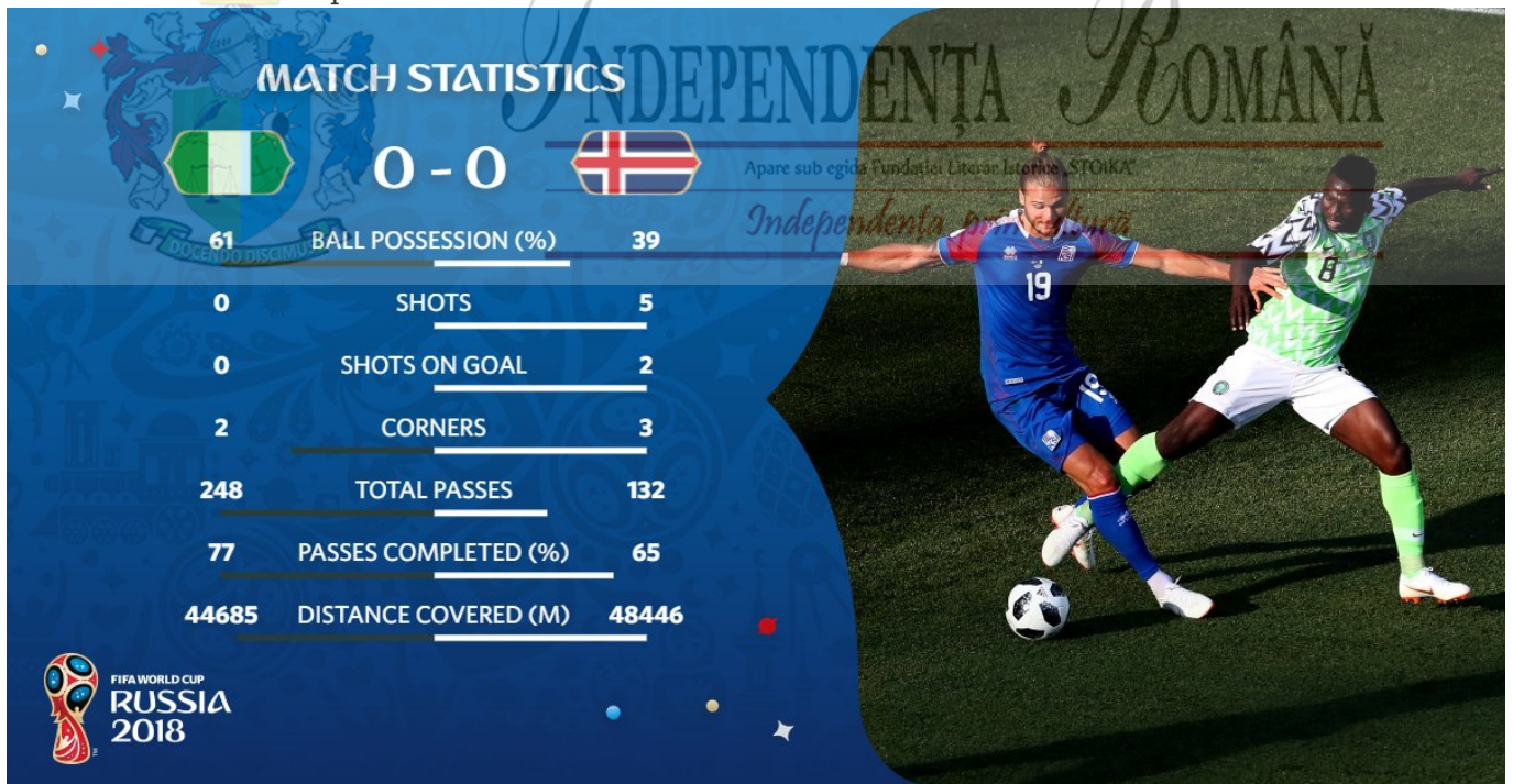
Twitter Fifa World Cup