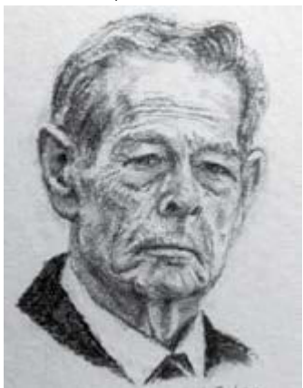
Regele Mihai, cărbune, 22 cmx25 cm, 2013

INDEPENDENȚA ROMÂNĂ Independența prin Cultură