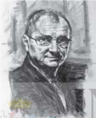
Horățiu Mălăele, cărbune, 27x35cm, 2013