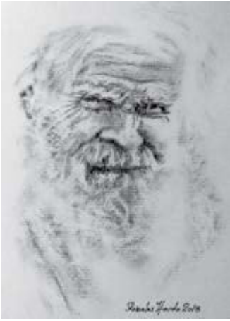
Moș, cărbune, 23 cm x 31 cm, 2013