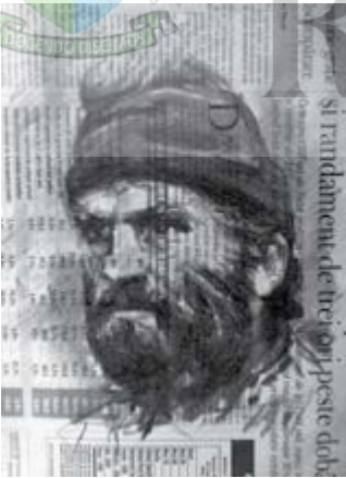
Dac, 25x32cm, cărbune pe ziar, 2013