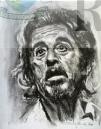
Al Pacino, cărbune pe hârtie, 27x35cm, 2015