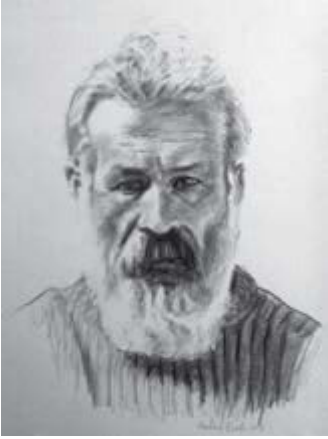
Constantin Brâncuși, 28x40cm, cărbune, 2014