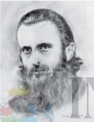
Arsenie Boca, cărbune, 2014