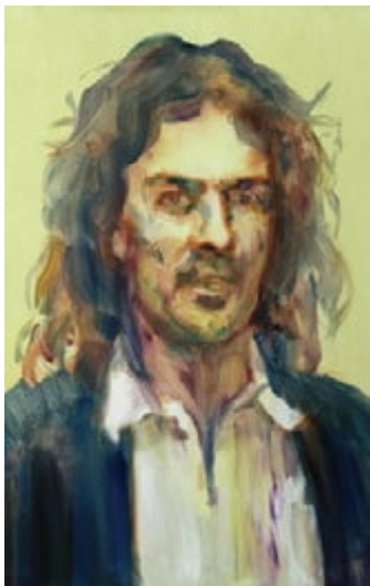
Elian Băcila, ulei pe pânză, 50x70cm, 2015