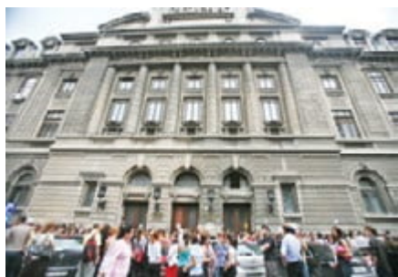
Universitatea București, Facultatea de Litere

Cercetări de teren, studii de antropologie, etnologie și folclor, legislație și management cultural, etnomuzicologie și etnocoreologie, dar și metode pentru păstrarea și valorificarea patrimoniului cultural tradițional - toate au contribuit la formarea ei ca viitor specialist în domeniu, dar și ca bun interpret al fenomenelor culturale moderne, într-o rapidă și continuă schimbare.