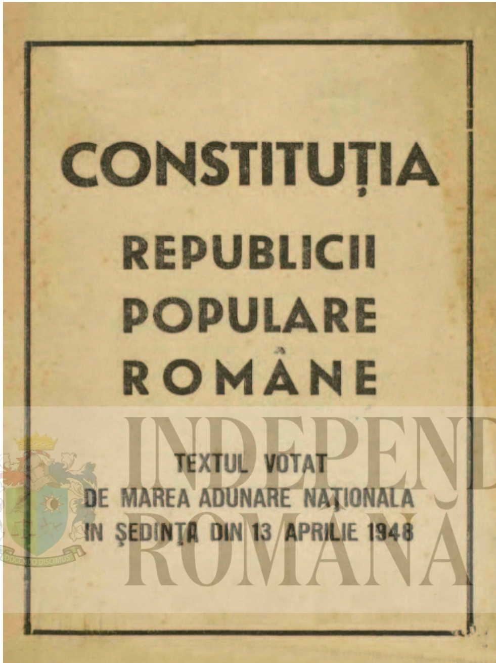
Constituția liberală din 1948