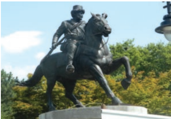
Statuia ecvestră de bronz a lui Pitu Guli din Macedonia

Însă moștenirea simbolică a Republicii de la Crușevo este una deosebit de importantă. Republica din 1903 este considerată drept precursorul statului macedonean de azi. Pitu Guli este, de asemenea, considerat drept unul dintre cei mai importanți eroi ai românilor balcanici însă este aproape necunoscut în România, în condițiile în care istoriografia oficială este concentrată asupra evenimentelor și personalităților românești de la nord de Dunăre și ignoră în mare măsură istoria celorlalte ramuri ale poporului român, aromânii, meglenoromânii și istroromânii. Statul macedonean a ridicat în onoarea și pentru amintirea eroului Pitu Guli o măreață statuie ecvestră din bronz. Faptele sale de vitejie au fost evocate în filme istorice și sunt cântate și astăzi în tradiția oral-folclorică a poporului. Dar cum sună Imnul de stat al Macedoniei, cel care spune povestea românului omagiat?