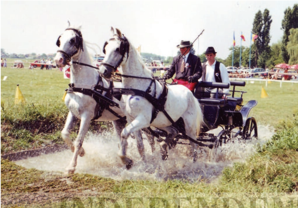
Atelaj din doi cai lipițani în Campionatul Național de Atelaje al României la Temeșeu-Bihor

Ca ramură sportivă, călăria a fost reprezentată pentru prima dată la Jocurile Olimpice de la Londra (1908), unde concursul de obstacole a fost câștigat de echipa engleză, însă primul concurs hipic internațional are loc un an mai târziu, în 1909. Începând din 1912, când la Jocurile Olimpice de la Stockholm s-au desfășurat probe de obstacole și dresaj fiind introdusă pentru întâia oară și proba completă, călăria a fost prezentă la toate Olimpiadele. În perioada interbelică sportul c[alare s-a organizat tot mai bine, prin înființarea Federațiilor Naționale, Federației Internaționale (1921) și a Comitetului Internațional Olimpic.