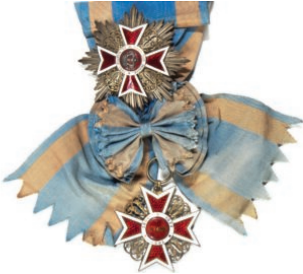
Ordinul „Coroana României” în gradul de Mare Cruce.

Mihail Pherekyde s-a născut în București la 14/26 noiembrie 1842. Și-a făcut studiile la Liceul Louis-le-Grand din Paris (1853- 1861) și, la 1866, s-a întors în țară cu titlul de doctor în drept. A intrat în politică la 1875. De la 24 aprilie 1876 până la 24 iulie același an a fost ministru al Justiției în cabinetul Ion Brătianu, iar de la 25 noiembrie 1878 până la 11 iulie 1879 a deținut portofoliul Lucrărilor Publice. La 10 aprilie 1881 a intrat în cabinetul Dim. Brătianu ca ministru al Justiției până la 16 noiembrie când a fost trimis la Paris ca ministru plenipotențiar, unde a stat până la 1884. De la 16 decembrie 1885 până la 1888 a deținut portofoliul Ministerului Afacerilor Străine (Dim. R. Rosetti, Dicționarul contimporanilor, București, 1897, p. 150).