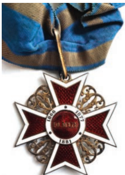
Ordinul „Coroana României” în