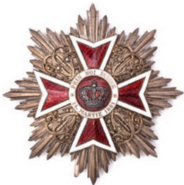
Ordinul „Coroana României”, placa de Mare Cruce (avers).

reproducerile grafice care provin de la Arhivele Naționale Istorice Centrale, Ministerul Afacerilor Externe. Cancelaria Ordinilor, dosar nr. 35/1886 (documentul), Cantacuzino (decorația în gradul de Mare Ofițer) și de la Complexul Muzeal Arad (decorația în gradul de Mare Cruce).