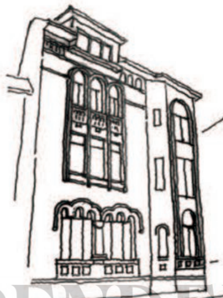
1924 - Imobil locuințe - str. Icoanei 40 - Virginia Andreescu-Haret