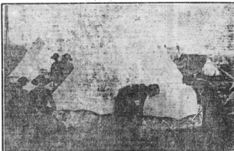
Infirmary ale Crucii Roșii franceze din grupe ambulanzelor sanitare își lăudă curajul lor în fața frontului apropiat de luptă.