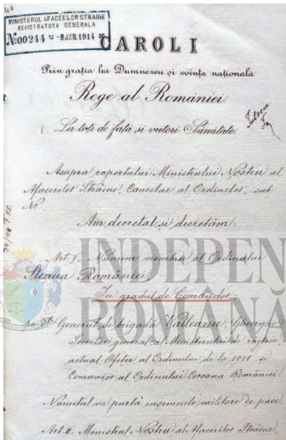
Decretul regal nr. 40 din 3 ianuarie 1914 (prima pagină).

Potrivit Regulamentului pentru punerea în aplicare a legii relativă la instituirea Ordinului „Steaua României”, sancționat prin Decretul regal nr. 3.505 din 11 octombrie 1906 (aflat, sub formă de copie, la Arhivele Naționale Istorice Centrale, Ministerul Afacerilor Externe. Cancelaria Ordinilor, dosar nr. 642), Ordinul „Steaua României”: „este o Cruce de smalt albastru-închis, înconjurată de raze, purtând deasupra coroana regală. Centrul Crucii, în formă de medalion, este de smalt roșu, având în față vulturul și în dos coroana și cifra regală.