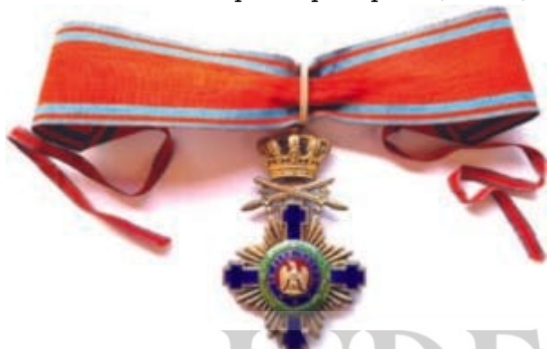
Ordinul „Steaua României” în gradul de Comandor, militar pe timp de pace (avers).

Însemnele Ordinului sunt de argint pentru Cavaleri și de aur pentru celelalte grade... Comandorii poartă de asemenea Crucea atârnată de aceeași panglică moarăță roșie cu dungile albastre-închis, ca mai sus, Crucea însă de un diametru de 60 mm și panglica lată de 45 mm și de o lungime egală cu periferia gâtului... Pentru militari, forma decorației este ca cea descrisă mai sus pentru civili, cu diferența numai că fiecare grad are, sub coroana regală și deasupra Crucii, două spade încrucișate cu vârful în sus și de același metal ca însăși Crucea”.