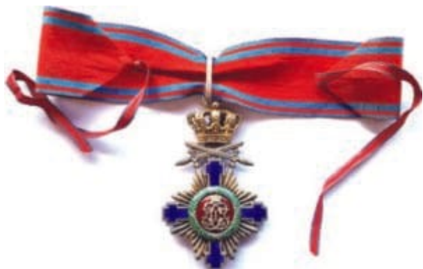
Ordinul „Steaua României” în gradul de Comandor, militar pe timp de pace (revers).