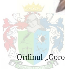
Ordinul „Coroana României”, placa de Mare Cruce

Placa de Mare-Cruce este de asemenea cu 8 raze, în mărime însă de 90 mm, având pe ea reprodușă, în relief, crucea ca cea de Comandor. Pe lângă placă, Marii-Cruci mai poartă atârnată, sub o fundă în formă de cravată, de vârful unei lente (cordon), o osebită cruce, în mărime de 70 mm, care, împreună cu placa și cu lenta, formează gradul de MareCruce. Însemnele Ordinului „Coroana României” sunt atârinate de o panglică moarăță, de culoare albastru-închis, cu câte o dungă pe fiecare margine de culoarea oțelului, dunga lată de 6 mm la Cavaleri și Ofițeri; de 8 mm la Comandori și Mari-Ofițeri și de 20 mm la Mari-Cruci... Lenta (cordonul) la Marii-Cruci este lată de 100 mm și de o lungime egală cu periferia bustului».