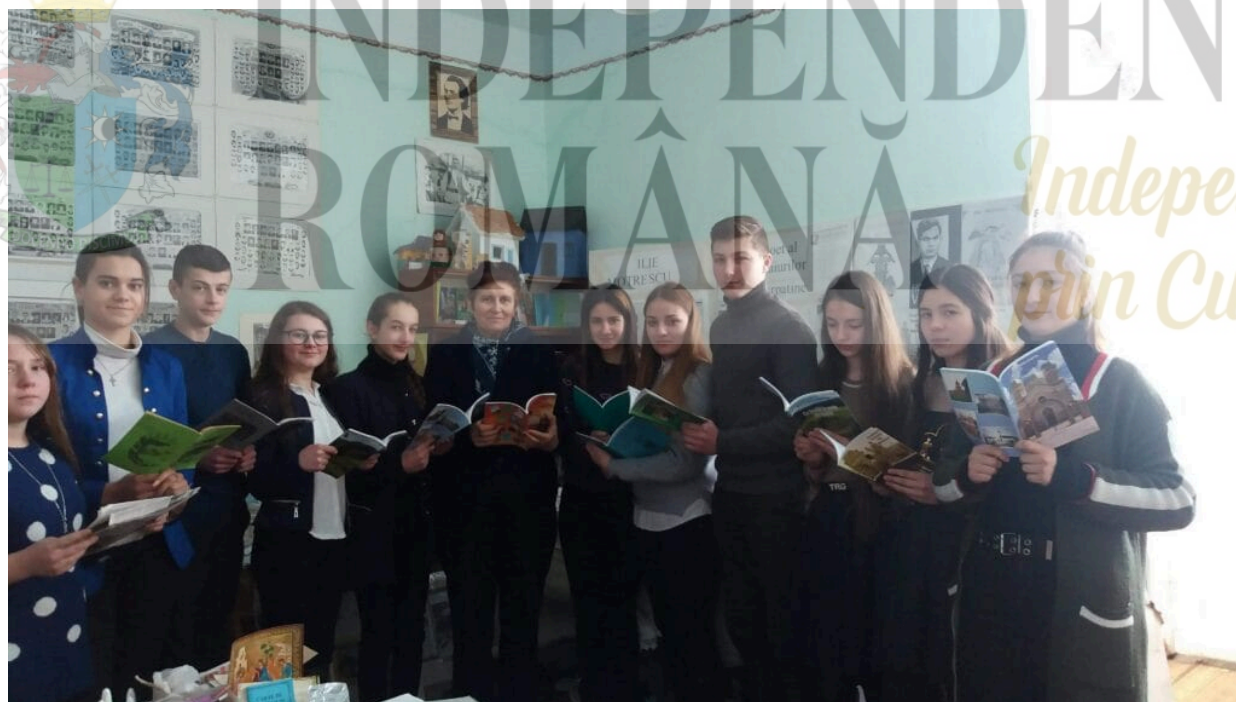
Membrii de acum cativa ani ai cenaclului literar „Lămâița”

Iartă-ne Maică și ne ajută să fim mai buni, mai credincioși, mai ascultători, mai răbdători, mai milostivi, mai înțelegători, să fim buni creștini, și buni români. Îndreaptă-ne pe calea cea dreaptă, și roagă-l pe Fiul Tău, pe Domnul nostru Iisus Hristos să ne ierte. Să ne ajute acum, când trecem prin timpuri grele, deosebit de grele. Fii cu noi de-a pururea, Maică Marie!