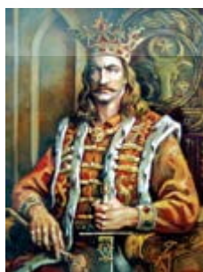
Ștefan cel Mare

Ștefan cel Mare - asasinat la ordinul Papei!