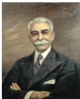
Pierre de Coubertin

Jocurile de la Olympia reprezintă o sinteză a tradițiilor unor popoare orientale peste care s-au suprapus și s-au impus tradiții și manifestări prezente în mitologia regatelor grecești. Vechea Eladă a întrupat în jocurile sale olimpice tot ceea ce a fost mai reprezentativ, mai civilizat în viața sportivă a Antichității, transformându-le într-o instituție reprezentativă a lumii.